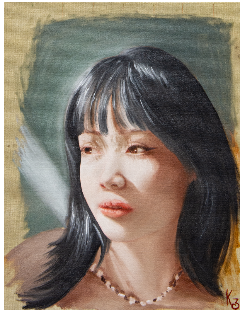
Nami, peinture à l'huile sur panneau, 24x30 cm, 2024