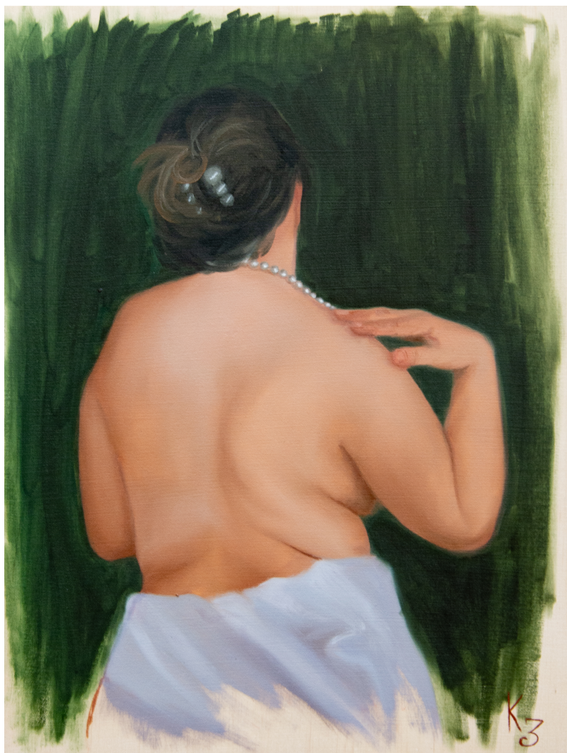
Dos nu, peinture à l'huile sur bois, 30x40 cm, 2025