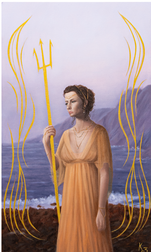
Amphitrite, peinture à l'huile sur bois, 30x50 cm, 2024