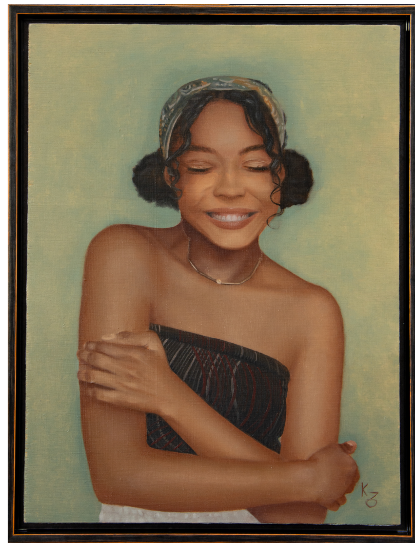
Aude, peinture à l'huile sur bois, 30x40 cm, 2023