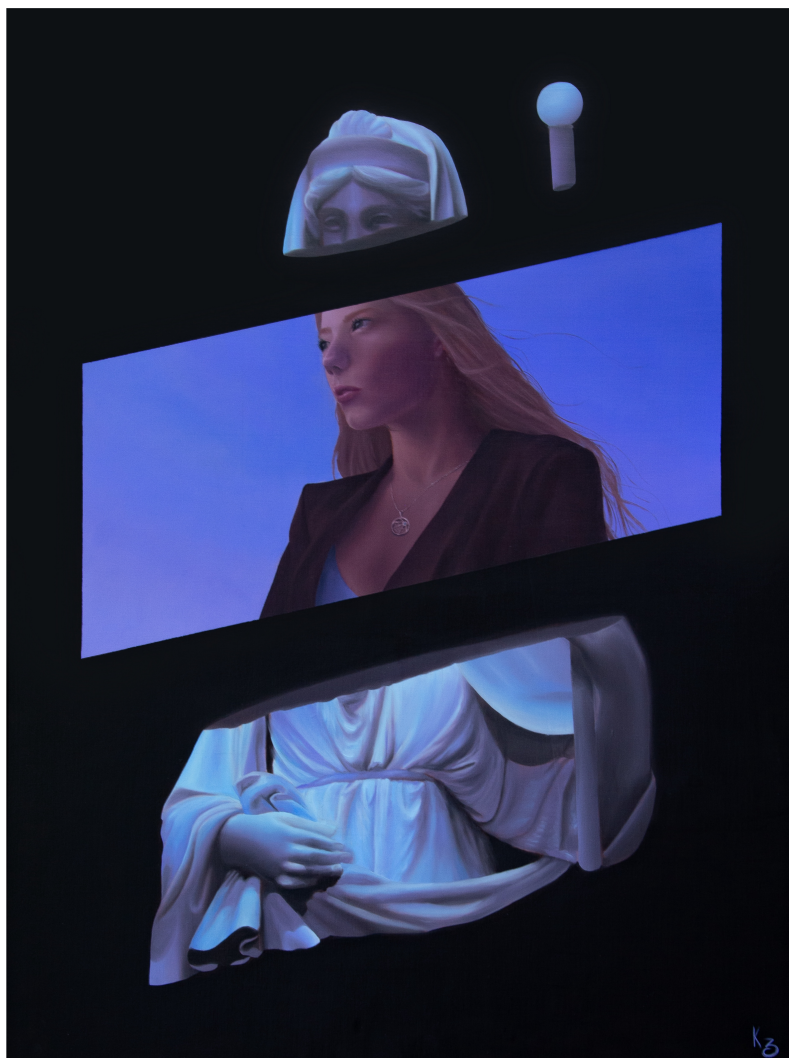
Vesta, peinture à l'huile sur bois, 60x80 cm, 2023