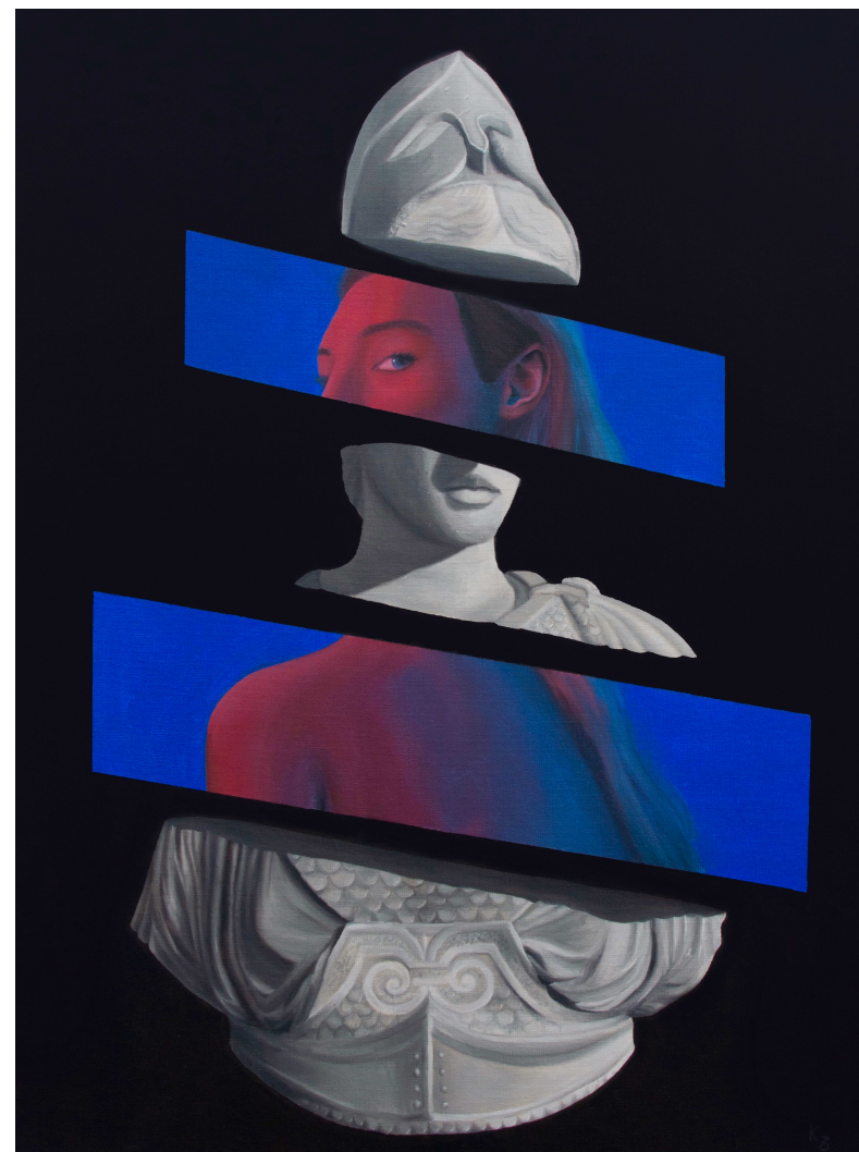
Armure, peinture à l'huile sur toile de lin, 60x80 cm, 2022