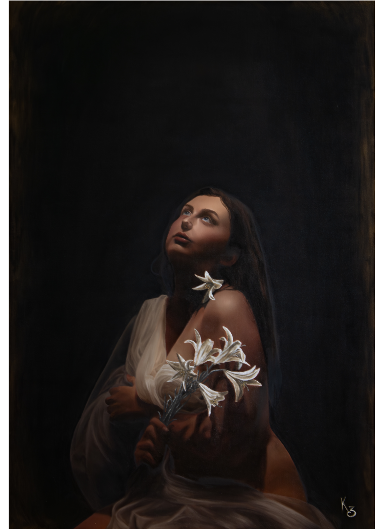
Hélène II, peinture à l'huile sur bois, 70x100 cm, 2024